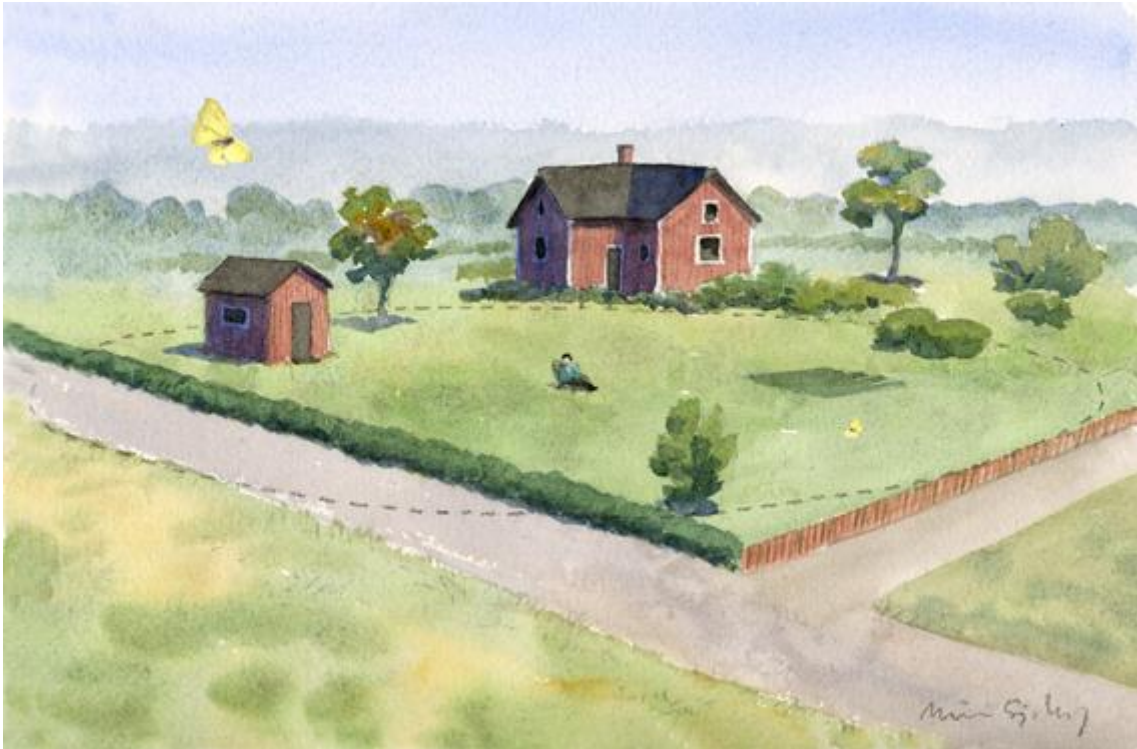
Figur 2. En punktlokal med observatören sittande i mitten och 25 m radie runt omkring.

Lokalbeskrivning: I början av varje säsong hör vi av oss till alla som har registrerat en ny punktlokal eller slinga för att lägga in den på kartan och beskriva de olika naturtyper som den täcker in. Du beskriver din nya lokal på en särskild blankett som vi skickar till dig. Har du redan varit med en säsong frågar vi under säsongen om någon del av lokalen ändrat karaktär (nya hyggen, bebyggelse eller liknande)