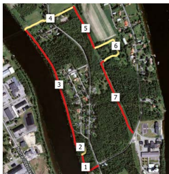
Figur 4. En slinga med 7 segment (Ön, Umeå)

Svensk Dagfjärilsövervakning, Lars Pettersson, Ekologihuset, 223 62 Lund