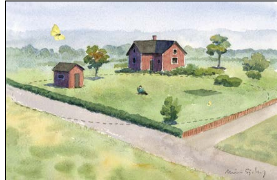
Figur 2. Inventering av punkt.

Det första att tänka på är om du vill gå en slinga eller ha en punkt. En slinga är normalt 0,5-3 km lång och täcker in olika naturtyper och livsmiljöer för fjärilar. Ingen del av slingan ligger närmare än 50 m från en annan del av samma slinga. Slingan delas in i ett antal segment utifrån de naturtyper du vandrar igenom, t ex betesmark, lövskog, kärr. Du inventerar slingan genom att i lugn promenadtakt räkna de fjärilar du ser framför dig, dels 2,5 m åt vardera sidan, dels 5 m framåt, dels 5 m uppåt (se Figur 1). Arter och deras antal noteras för varje segment och inventeringstillfälle. Om en fjäril behöver studeras närmare för artbestämning avbryter man vandrigen tillfälligt och fortsätter sedan igen från samma plats. Det är bra om slingan inte är alltför otillgänglig eller alltför arbetsam att inventera. Målet är att följa fjärilarnas antal över ett antal år så lägg upp slingan för en lagom arbetsinsats.