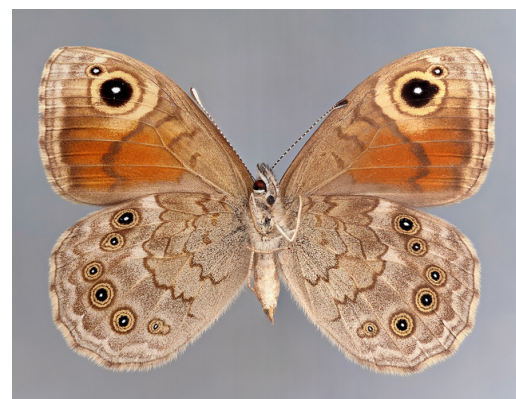
Vitgräsfjäril Lasiommata maera (övre rad: hanne undre rad: hona)