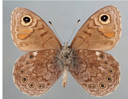
Berggräsfjäril Lasiommata petropolitana (övre rad: hanne undre rad: hona)