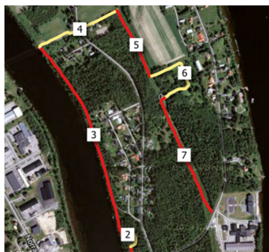
En slinga med 7 segment (Ön, Umeå)